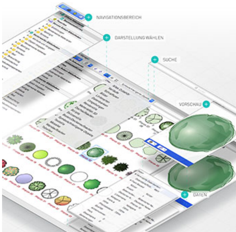
Der neue Objekt-Manager revolutioniert die Verwendung von Symbolen etc.