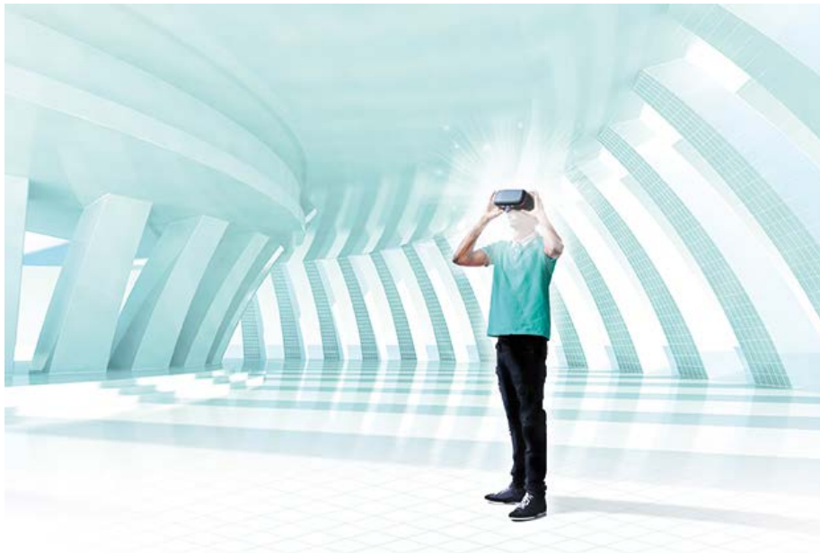
Virtual Reality Erlebnisse für Kunden