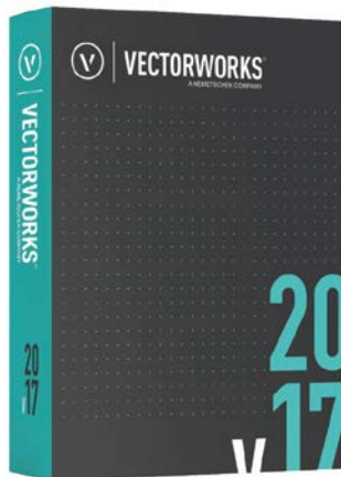
Boxshot Vectorworks 2017